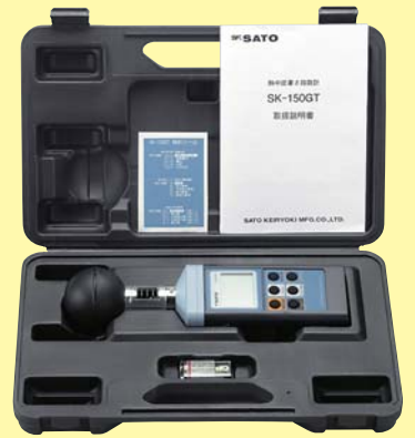
SK-150GT専用ハードケース

●黒球温度計・温度計・湿度計が一体となった、ハンディタイプのWBGT指数測定器です。 熱中症予防の目安や、労働環境の熱ストレスの評価として使用されるWBGT指数をはかることができます。